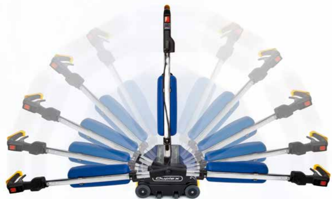
SYSTÈME BIDIRECTIONNEL DE LAVAGE

La machine est équipée d'une poignée d'allumage et d'extinction selon les normes ENEC® et SEV®.